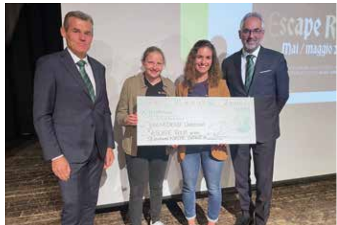
3. Preis Jugenddienst Unterland