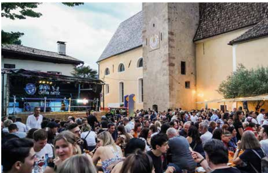
Die Vereinsstände waren jeden Abend voll besetzt