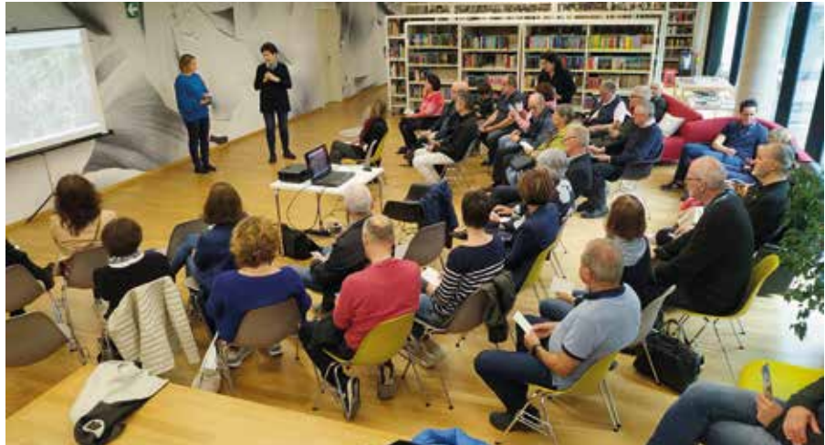
Gut besuchte Diskussionsrunde in der Bibliothek.