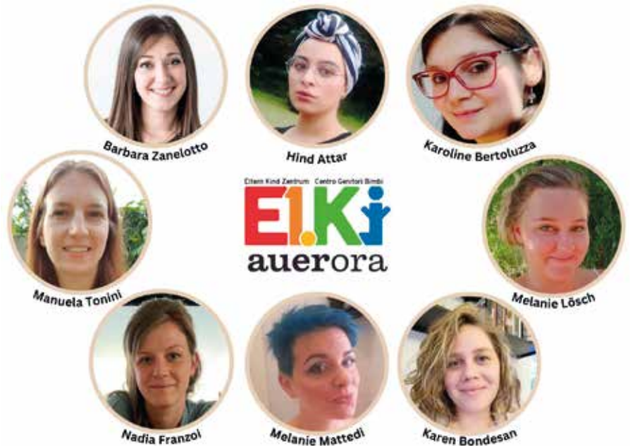
Der Ausschuss des ELKI