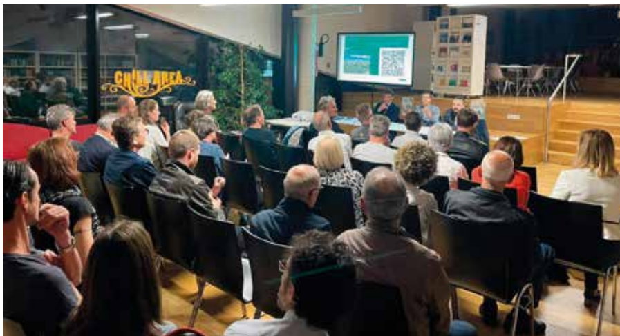
Informationsabend zum Thema Energiegemeinschaften.

Privatpersonen, Betriebe und öffentliche Verwaltungen, die sich zu einer Energiegemeinschaft zusammenschließen, können den von ihnen nachhaltig produzierten Strom wiederum den Verbrauchern innerhalb der EEG virtuell zur Verfügung stellen. Es handelt sich also um eine kollaborative Energieform, die sich auf ein lokales Austauschsystem stützt. Besitzer von Photovoltaikanlagen können ihre überschüssige Energie mit anderen Bürgern virtuell teilen. Dabei wird die gleichzeitig produzierte und verbrauchte Energie gefördert. Die Referenten informierten die Bürger über die wichtigsten Aspekte zum Thema und beantworteten viele Fragen aus dem Publikum. Alle interessierten Bürger und Unternehmen