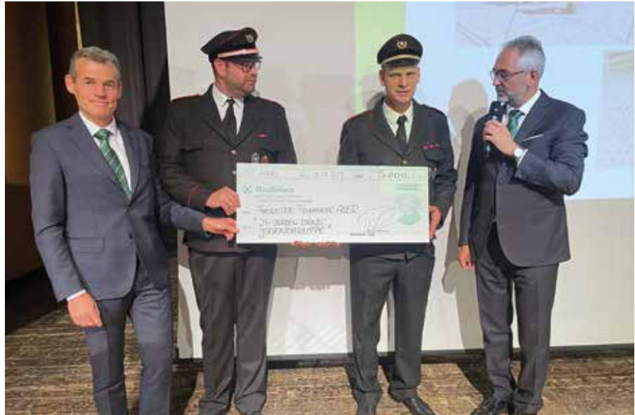
1. Preis Freiwillige Feuerwehr Auer