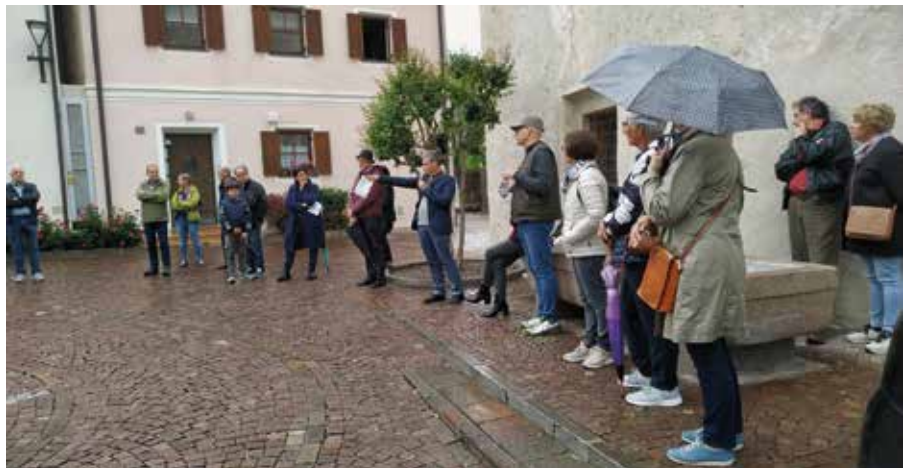
Am Platz vor dem Tscharfhaus

Sie muss so wie bisher in der Hand der Gemeinde bleiben, mit dem Ziel einer maßvollen Dorfentwicklung und Verkehrsplanung zum Wohle der Menschen.