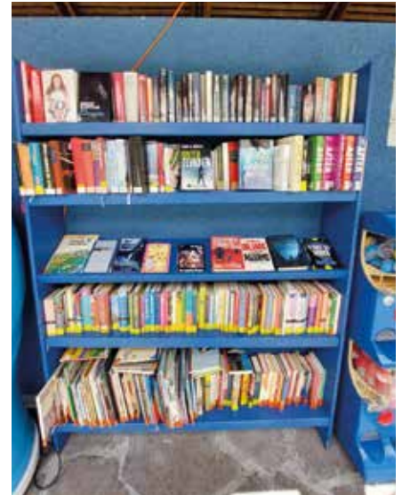
Bibliotheksregal im Schwimmbad

Das Bookcrossing-Regal im Freibad Auer Wem beim Besuch im Aurer Schwimmbad die Lektüre ausgeht, dem kann geholfen werden: Auch in diesem Jahr wurde das „Bookcrossing“-Regal des Freibads von den beiden Bibliotheken mit Büchern für Groß und Klein gefüllt, die gerne mitgenommen und dann behalten oder auch wieder zurückgestellt werden können. Die Auswahl ist groß, somit ist hoffentlich für alle etwas dabei. Auch ein „Wasserschaden“ ist bei diesen Büchern halb so wild, da sie ja nicht zurückgegeben werden müssen. Wir wünschen einen wunderbaren (Lese-)Sommer!