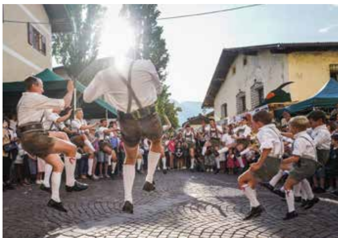
Auftritt der Schuhplattler nach dem Einzug