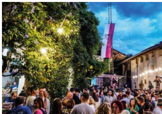
Besondere Atmosphäre herrscht in den alten Innenhöfen