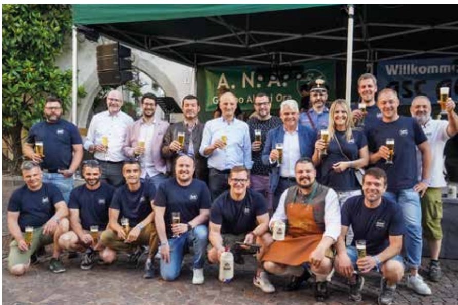
Nach dem Fassanstich

Das Altmauerfest 2023 in Auer wird als ein besonderes Ereignis in Erinnerung bleiben. Die positive Resonanz der Besucher und die erfolgreiche Umsetzung des Festes sind ein Beweis für das Engagement und die Zusammenarbeit aller Beteiligten.