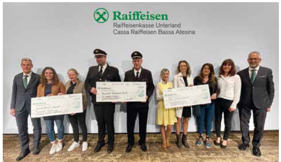
Prämierung der drei Sieger des Förderwettbewerbs 2022/2023

Der Sieg und damit der Siegerscheck über 5.000 Euro ging an die Freiwillige Feuerwehr Auer, welcher sich mit dem Projekt „24-Stunden-Dienst der Jugendgruppe FF Auer“ die meisten Mitgliederstimmen sichern konnte. Bei diesem Projekt stand die Begeisterung der Jugendlichen für das Feuerwehrwesen im Vor-