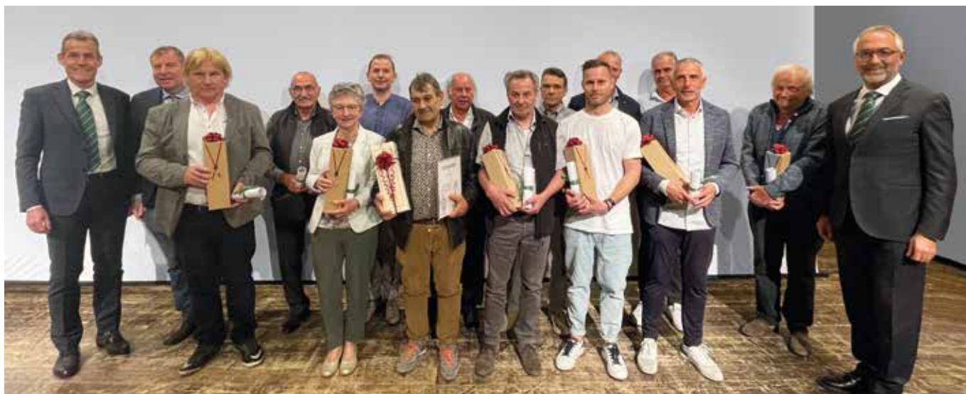
Ehrung der langjährigen Mitglieder

Die Raiffeisenkasse Unterland konnte am 5. Mai bei der Jahresvollversammlung in der Aula Magna in Auer mit knapp 300 Mitgliedern eine überaus positive Bilanz über das Geschäftsjahr 2022 ziehen.