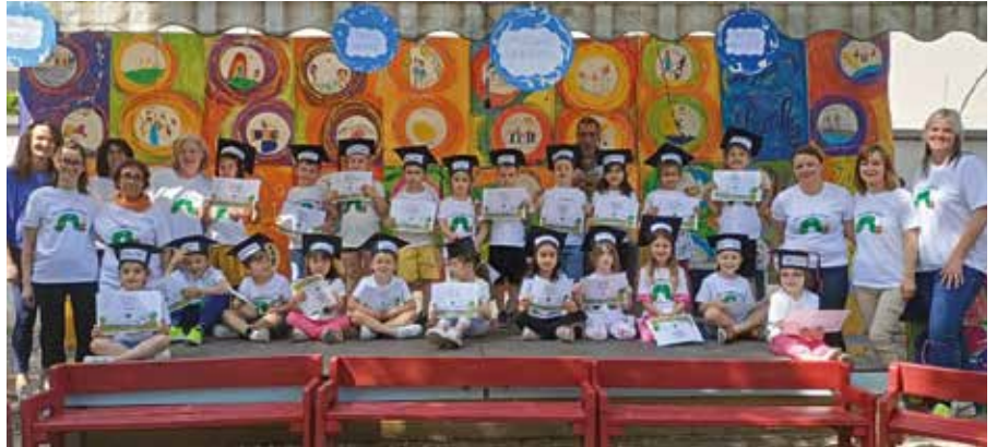
La scuola dell'infanzia "Millepiedi" di Ora ha chiuso l'attività di quest'anno con una bella e sentita festa

Molto suggestivo e coinvolgente è stato il momento, nel quale, ad ogni bambino è stato fatto indossare il "tocco", ossia il cappello di chi si laurea dopo aver frequentato l'Uni-