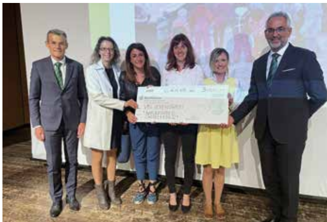
2. Preis Lebensbaum

mitgemacht und damit ebenso zum Erfolg dieser Initiative beigetragen haben.