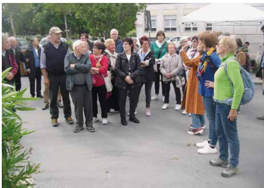
Bei der Stadtführung in Brescia

Trotz des einsetzenden Regens am Beginn unserer Fahrt, verzogen sich die Wolken allmählich je näher wir unserem Ziel kamen. Nach einer kurzen Kaffeepause erreichten wir am späten Vormittag Brescia die heuer, wie auch Bergamo, zur Kulturstadt Italiens erwählt wurde. Dort erwartete uns bereits die Stadtführung, welche uns dann zu Fuß durch die sehenswerte Altstadt führte. Viel Interessantes und Wissenswertes erfuhren wir beim historischen Rundgang. Wir trafen auf antike Bauwerke, frühchristliche Sakralkunst, romanische und gotische Kirchen sowie eindrucksvolle Plätze und Paläste. Einige dieser kulturhistorischen Gebäude wurden im Jahr 2011 ins UNESCO-Weltkulturerbe aufgenommen. Etwas erschöpft vom langen Fußmarsch durch die Stadt kamen wir schließlich zum Restau-